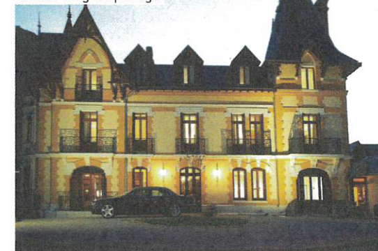
Manoir d'Agnès | Ariège

les participants du Tour de France et de la course locale, L'Ariégeoise, mais aussi tous les amoureux de la Petite Reine. Abri et matériel de réparation et de lavage figurent donc parmi les services offerts par cet hôtel trois étoiles. Il est idéalement situé à Tarascon-sur-Ariège, au cœur des montagnes et des circuits prisés des cyclistes, sur la route qui mène de Toulouse à l'Espagne, au Pas de la Case ou