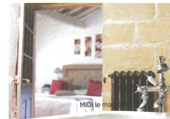
MIDI le ma

L'INFO EN Château Le Stelsia Resort Lieu-dit Lalande, 47140 Saint-Sylvestre-sur-Lot 05 53 01 14 86