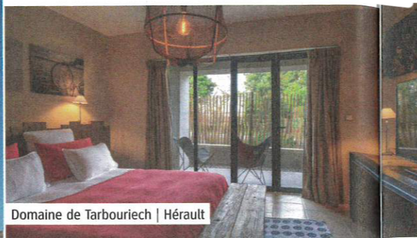
Domaine de Tarbouriech | Hérault