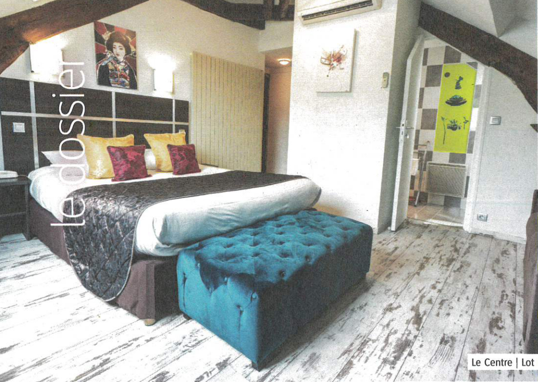
Le Centre | Lot