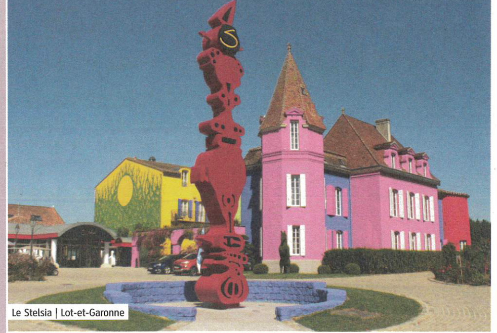
Le Stelsia | Lot-et-Garonne

L'INFO EN Le Viscos | 1 rue Lamarque, 65400 Saint-Savin | 05 62 97 02 28