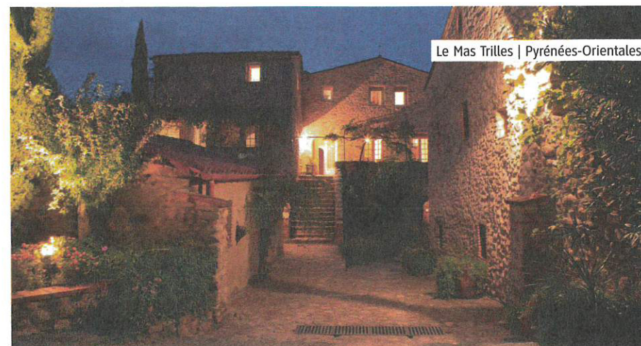
Le Mas Trilles | Pyrénées-Orientales

L'établissement des Saint-Martin a des allures de maison de poupée, au cœur de Saint-Savin. Sept générations se sont succédé au sein de cet hôtel tout en délicatesse, qui donne sur la place du village, où l'abbatiale du XI e siècle dégage une atmosphère mystique. Chacune des dix chambres du Viscos, dont certaines sont