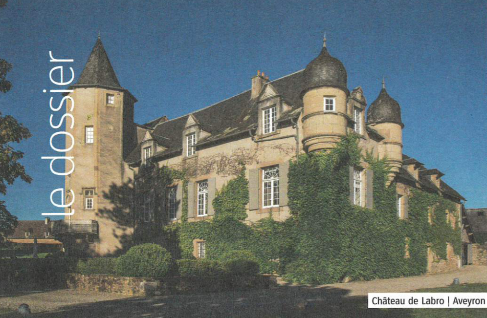
Château de Labro | Aveyron