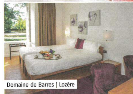
Domaine de Barres | Lozère

encore à l'Andorre. Avec sa splendide demeure bourgeoise du XIX e siècle, aux formes fines et au toit pointu, l'établissement a beaucoup de caractère. Abrité dans un manoir rénové avec soin, il offre le charme d'antan et l'élégance d'aujourd'hui. Ses 15 chambres sont spacieuses, lumineuses et meublées dans un design contemporain. Certaines sont dotées de balcons donnant sur un parc arboré centenaire. Hammam, massage... Tout est réuni pour faire d'un séjour dans cette ancienne dépendance de l'usine Péchiney, un moment d'exception. Dans son restaurant gastronomique, Les Saveurs du Manoir, le chef Jean Cazorla sert une cuisine traditionnelle avec des produits locaux : foie gras, agneau, veau... L'emplacement du Manoir d'Agnès permet de