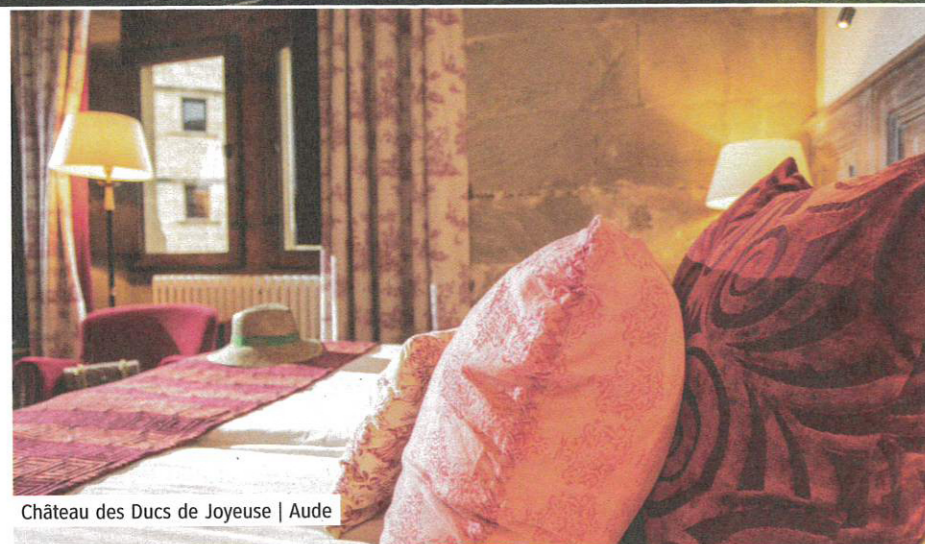
Château des Ducs de Joyeuse | Aude