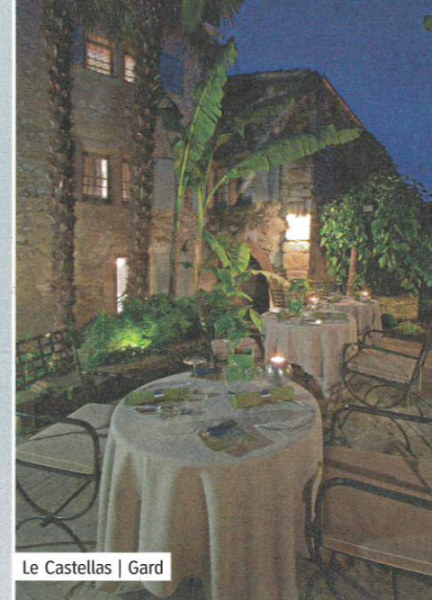
Le Castellás | Gard

Voici une adresse très appréciée par les amoureux. Entre le pont du Gard et Uzès se niche un véritable cocon au charme poétique : le Castellás. Caché au cœur du village de Collias, cet hôtel 4 étoiles est agencé autour d'un patio. Plusieurs demeures du XVII e siècle distillent leurs