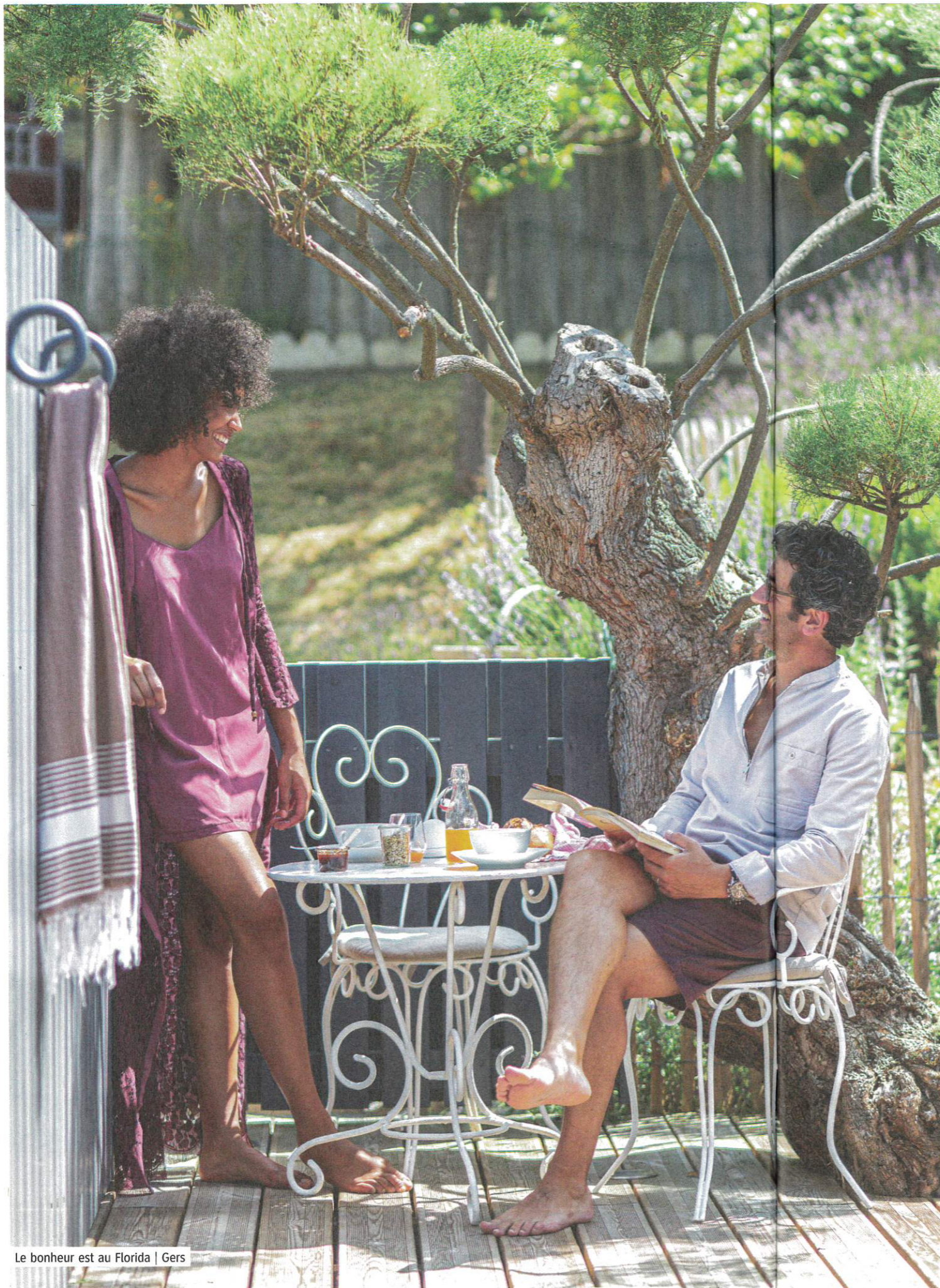
Le bonheur est au Florida | Gers