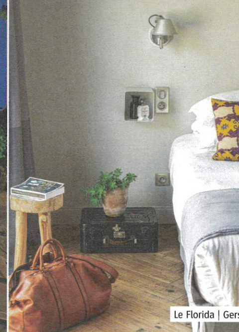
Le Florida | Gers