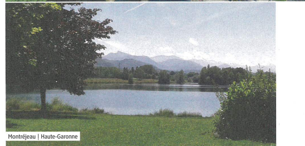
Montréal | Haute-Garonne

paddles, karts à pédales, aire de jeux, appareils de fitness), marche nordique, circuit pour les vélos raviront les sportifs. Durant la saison, des animations déchets et pêche sont proposées aux enfants. Pour la saison 2021, des hôtels à insectes vont être positionnés et une campagne "0 déchet" va être déployée sur la plage et sur la base de loisirs. Enfin, à proximité, se trouvent le patrimoine naturel de la zone Natura 2000 et le magnifique château de Valmirande.