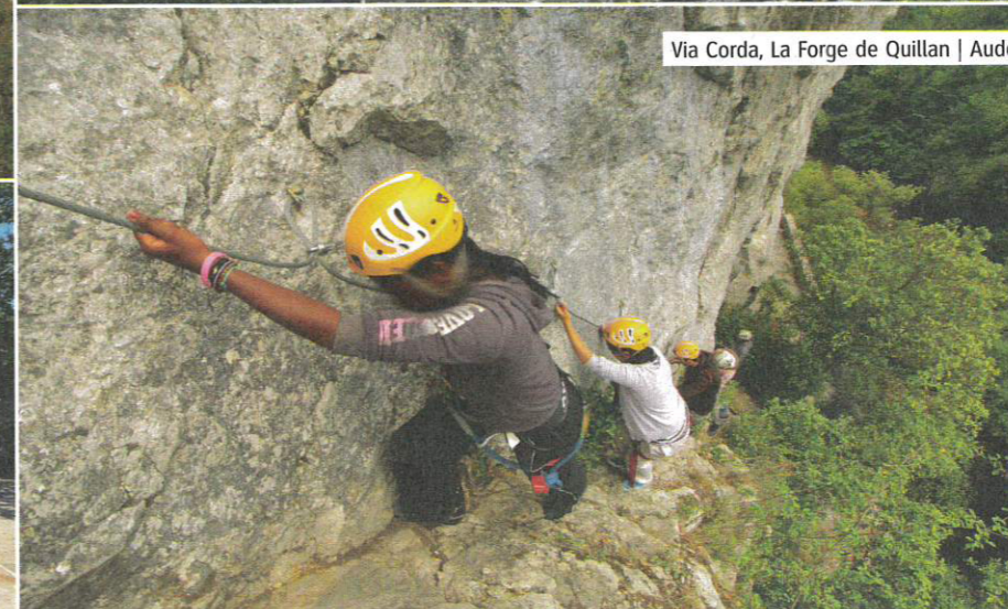
Via Corda, La Forge de Quillan | Aude