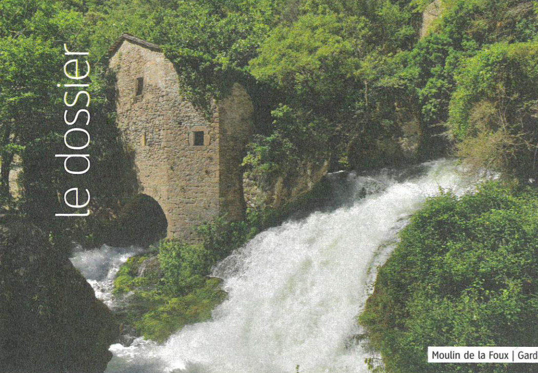
Moulin de la Foux | Gard