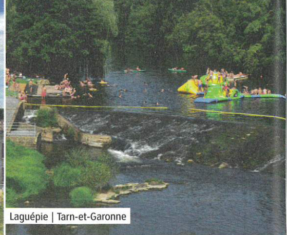
Laguëpie | Tarn-et-Garonne

... sont multiples. Le guide "Randonnées et balades" recense tous les parcours balisés, empruntant des espaces naturels et des lieux historiques. Il est proposé par l'office de tourisme et comprend les différentes courses de montagne ou trail ainsi que les nombreuses randonnées. Pour les férus, des circuits plus longs s'envisagent avec la véloroute voie verte ou carrément le Pirinexus, boucle transfrontalière de plus de 350 km. La commune est aussi une station "nordic walk" dont le concept propose un lieu 100% marche nordique avec des outils et des services dédiés aux néophytes comme aux passionnés.