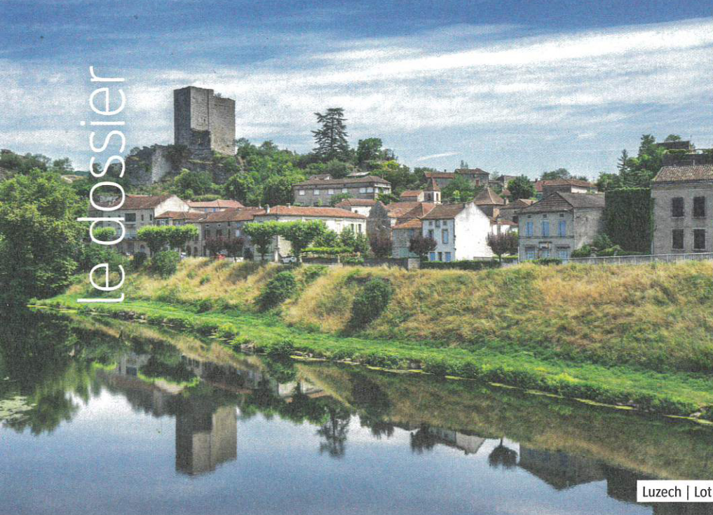
Luzech | Lot