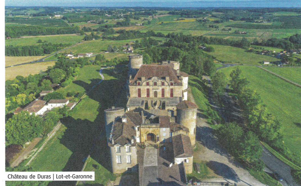
Château de Duras | Lot-et-Garonne

Au pied des Pyrénées, cette ancienne bastide, créée en 1272, conserve ses arcades sur la place centrale, l'église Saint-Jean des XII e et XV e siècles et son clocher des XVII e et XVIII e siècles. Dans son écrin de verdure, de nombreuses activités de pleine nature au choix. La baignade est surveillée en saison et la base nautique bénéficie du label handiplage et du pavillon bleu. Parcours d'orientation, sentier pédagogique au bord du lac (avec