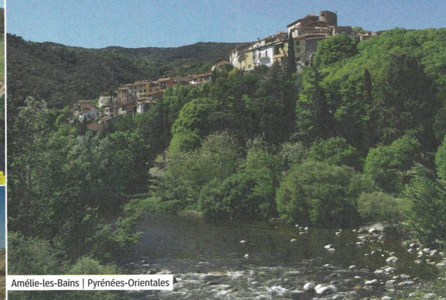
Amélie-les-Bains | Pyrénées-Orientales