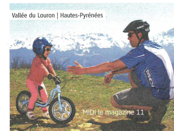
Vallée du Louron | Hautes-Pyrénées