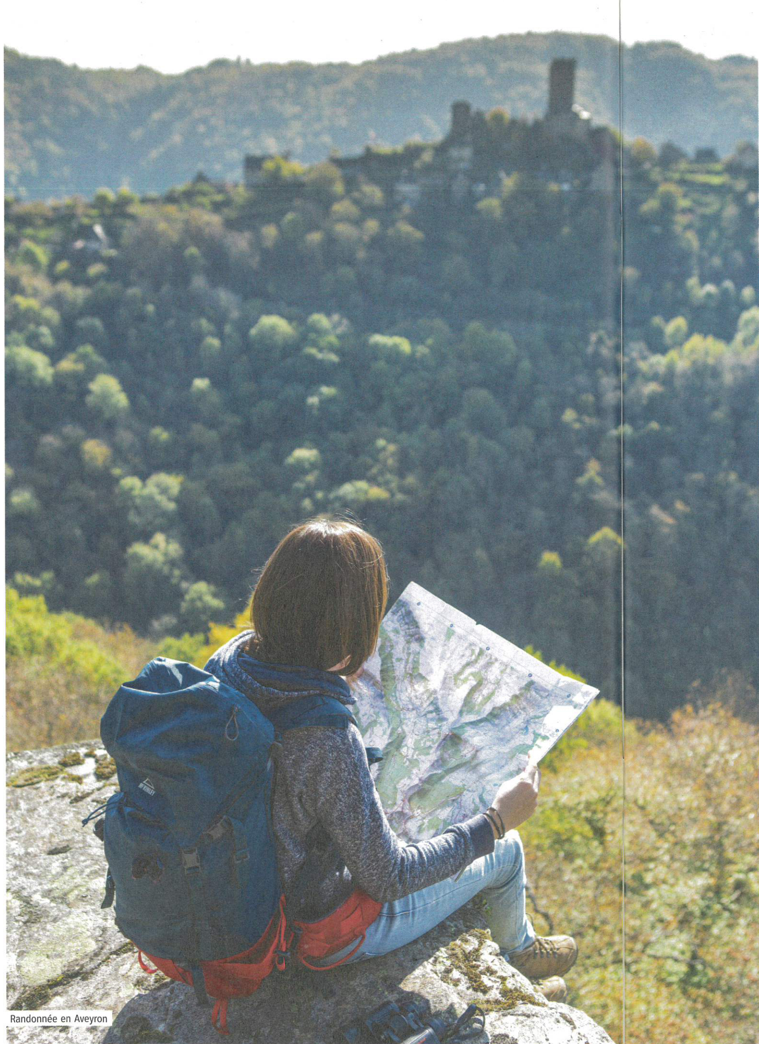
Randonnée en Aveyron