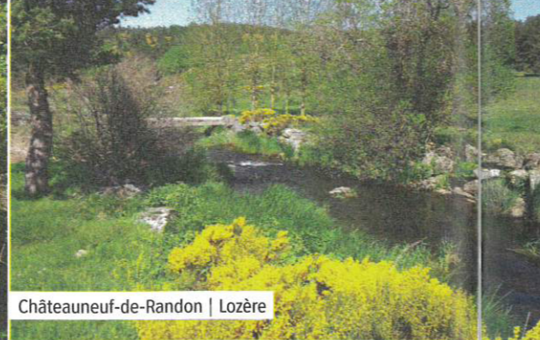
Châteauneuf-de-Randon | Lozère