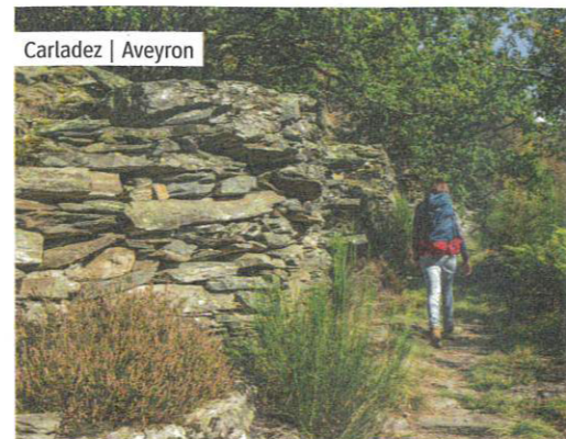
Carladez | Aveyron