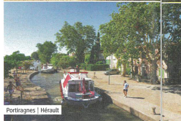
Portiragnes | Hérault