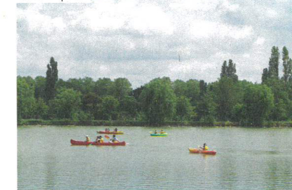
Samatan | Gers

Groupement de trois villages en bordure du Tech et du Mondony, Amélie-les-Bains, Palalda et Montalba d'Amélie, la station se trouve au cœur du territoire préservé du Vallespir. Quatrième station thermale française, elle est réputée pour ses eaux. Au-delà de ses thermes romains et de la tour du château de Palalda, la commune possède des monuments historiques remarquables, comme la chapelle romane Santa Engracia, située en pleine montagne, des églises, les vestiges du château du Mondony, les sept nécropoles... Les possibilités d'activités de plein air