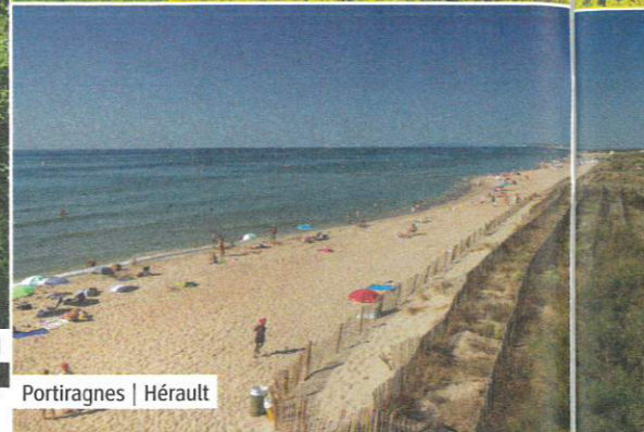
Portiragnes | Hérault