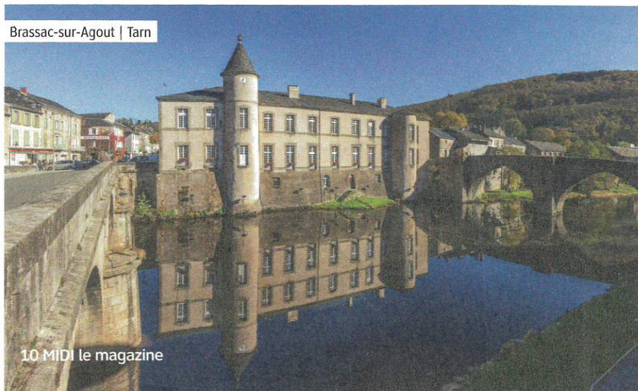
Brassac-sur-Agout | Tarn

Note : toutes les dates et manifestations indiquées sont bien évidemment sous réserve de conditions sanitaires favorables. ●