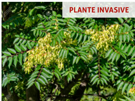
Ailante Ailanthus altissima