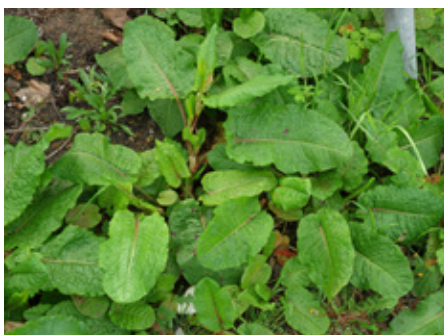
Rumex à feuilles obtuses Rumex obtusifolius