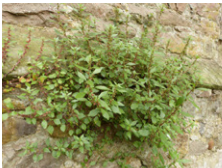
Pariétaire de Judée Parietaria judaica