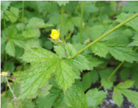
Benoite des villes Geum urbanum