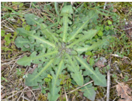
Porcelle enracinée Hypochaeris radicata