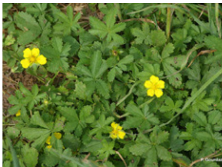
Potentille rampante Potentilla reptans