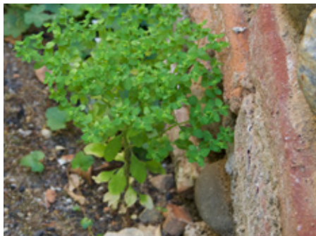
Euphorbe des jardins Euphorbia peplus