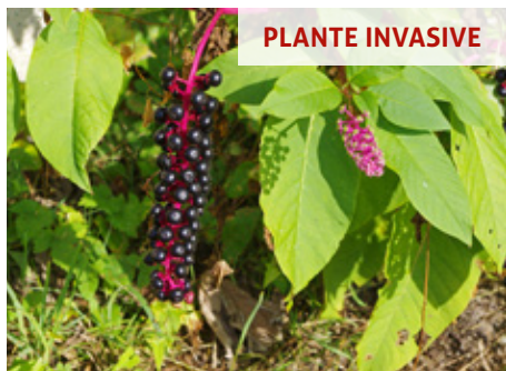
Raisin d'Amérique Phytolacca americana