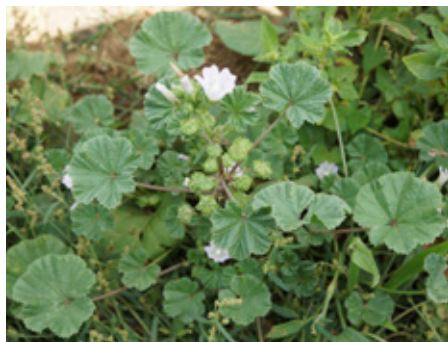
Mauve à feuille ronde Malva neglecta