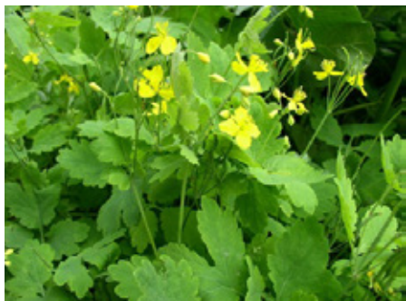
Chelidoine Chelidonium majus