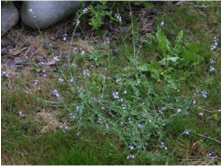
Vervaine officinale Verbena officinalis