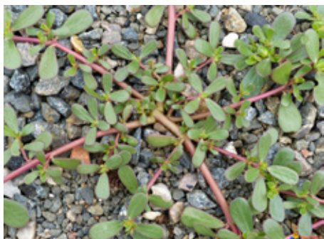
Pourpier commun Portulaca oleracea