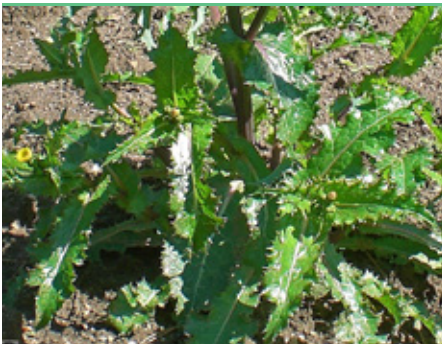
Laiteron rude Sonchus asper