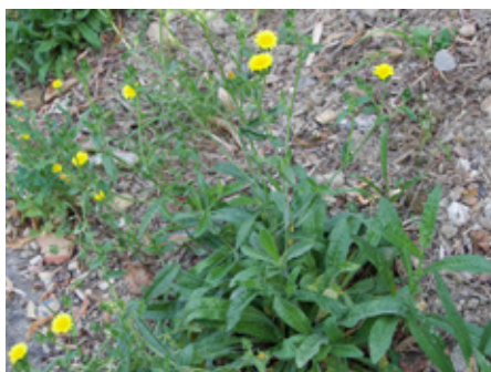
Picris fausse vipérine Picris echioides