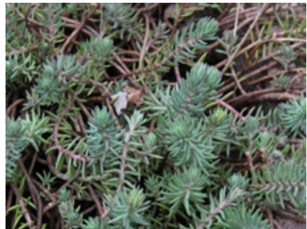
Orpin rupestre sedum reflexum