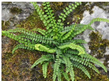
Fougère capillaire Asplenium trichomanes