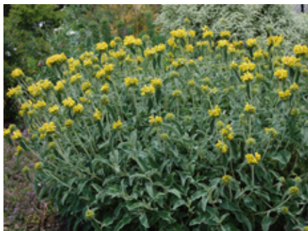
Sauge de Jerusalem Phlomis fruticosa