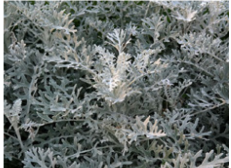
Seneçon maritime Cineraria maritima