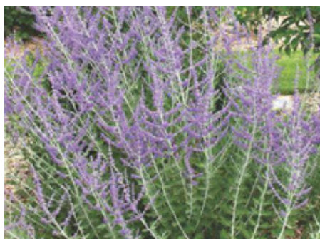
Sauge d'afghanistan Perovskia atriplicifolia