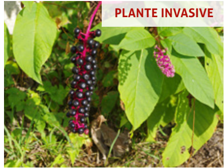
Raisin d'Amérique Phytolacca americana