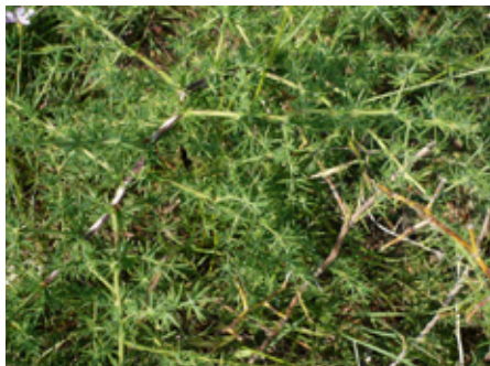
Asperge sauvage Asparagus acutifolius