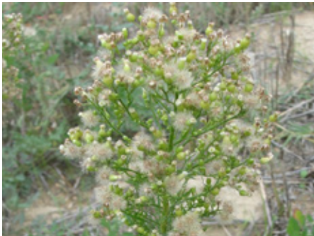
Vergerette du Canada Erigeron canadensis