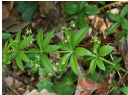
Garance voyageuse Rubia peregrina