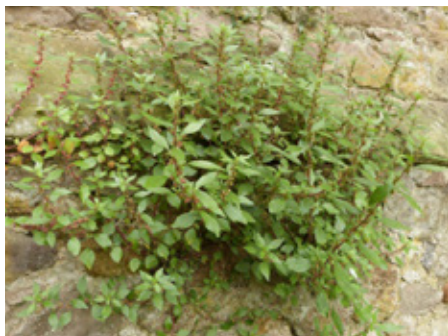
Pariétaire de Judée parietaria judaica