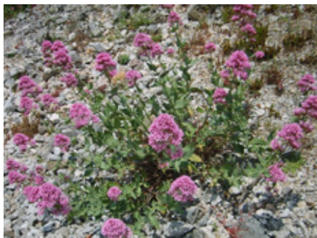
Lilas d'Espagne Centranthus ruber