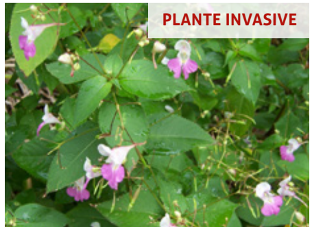
Balsamine de Balfour Impatiens balfourii