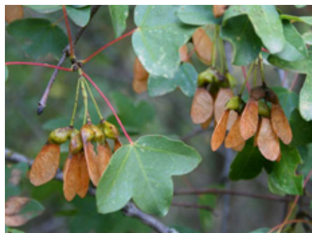
Erable de Montpellier Acer monspessulanum