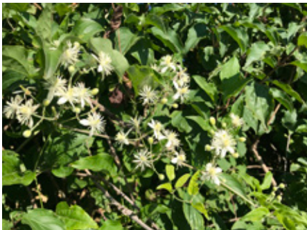
Clématite vigne blanche Clematis vitalba