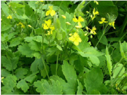
Chelidoine Chelidonium majus