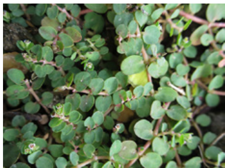
Euphorbe rampante Euphorbia serpens