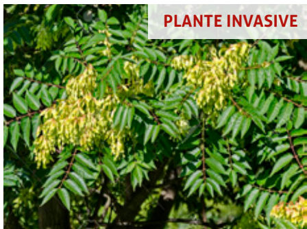
Ailante Ailanthus altissima