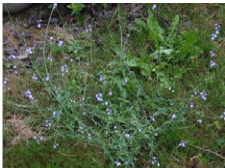
Verveine officinale Verbena officinalis