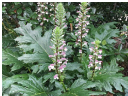
Acanthe Acanthus mollis