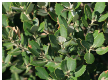
Chêne vert Quercus ilex