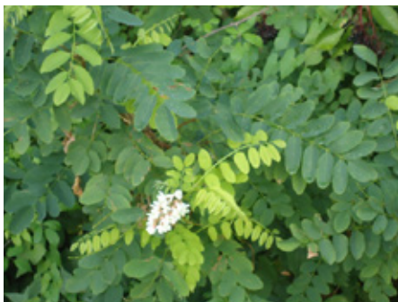
Robinier faux-acacia Robinia pseudoacacia