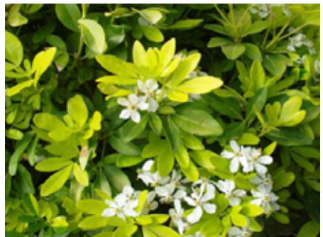
Oranger du Mexique Choisya ternata