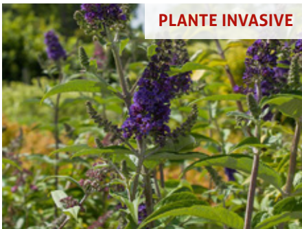
Arbre aux papillons Buddleja davidii