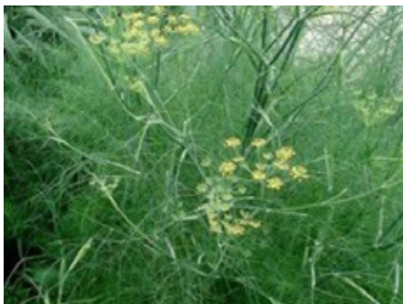
Fenouil Foeniculum vulgare