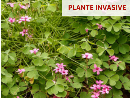
Oxalis articulée Oxalis articulata