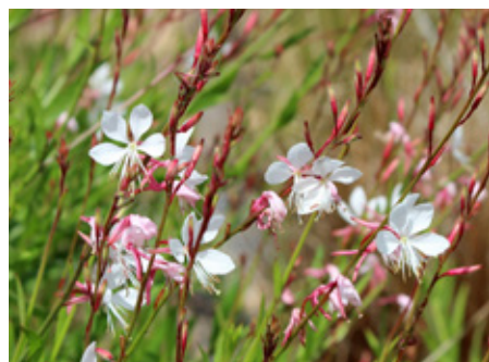
Gaura Gaura lindheimeri