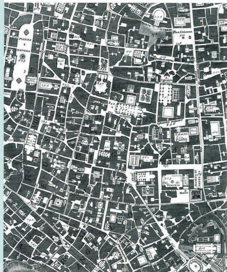
Le plan de Giambattista Nolli