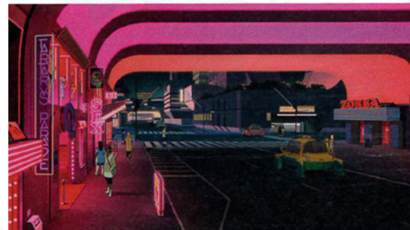
Photo : Photogramme extrait du film Mars Express