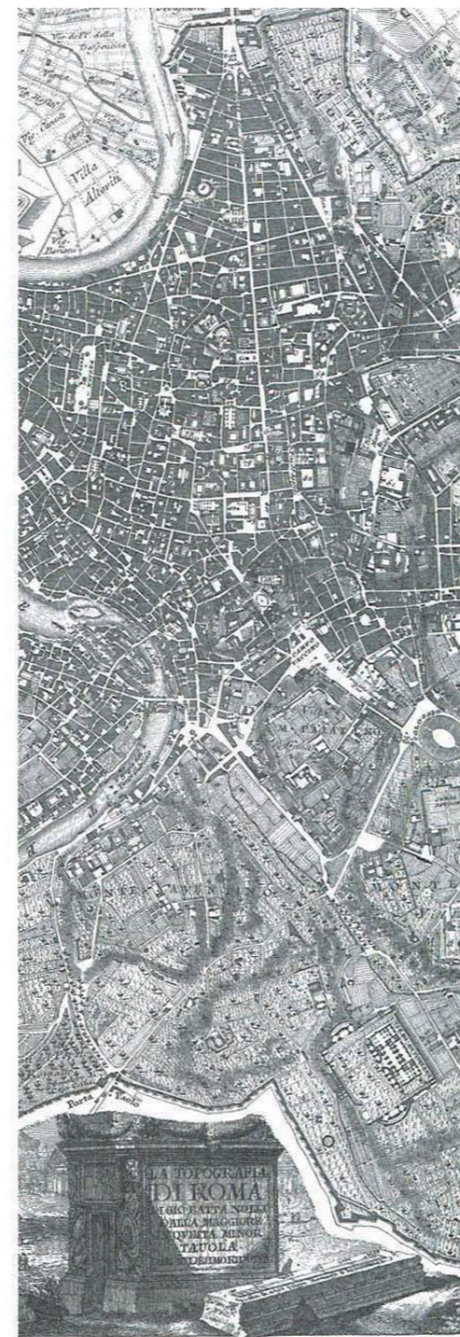
Plan de Rome de Nelli.