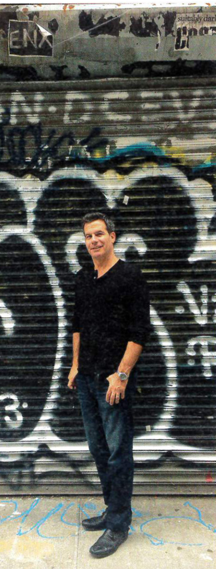
Richard Florida.